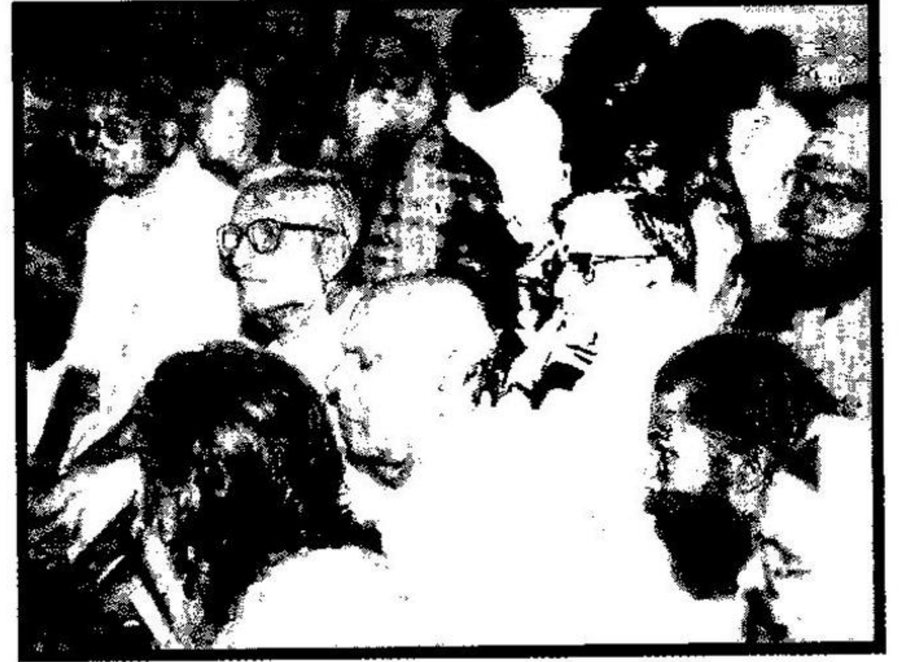
स्व. अशोकजी सिंघल व श्री. मुरली मनोहर जोशी यांच्या समवेत