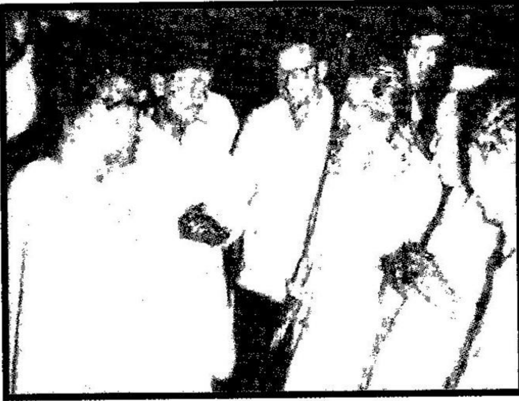
प. पू. श्री. गुरुजी समवेत